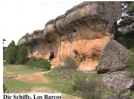
Die Schiffe, Los Barcos

Von der Verzauberten Stadt sind es nochmals 47 km über Uña und Tragacete bis zum Ursprung des Flusses Cuervo, Nacimiento del Cuervo .