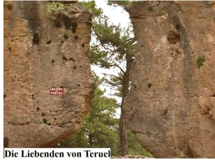
Die Liebenden von Teruel