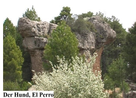
Der Hund, El Perro