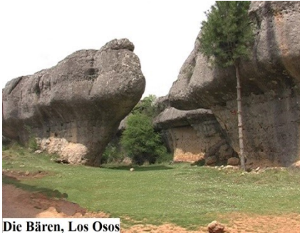
Die Bären, Los Osos