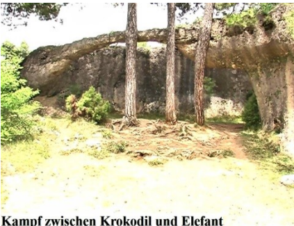
Kampf zwischen Krokodil und Elefant